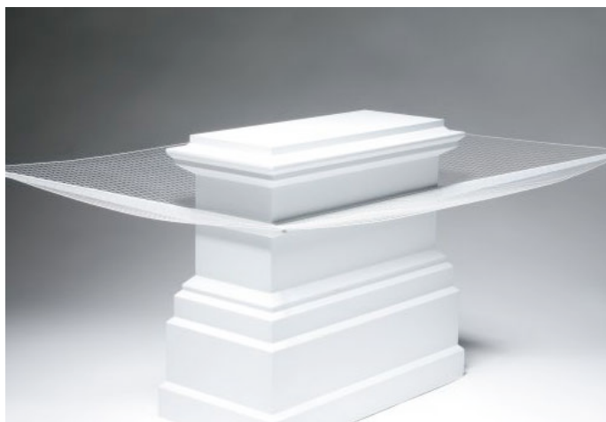
Suzan Valadon - La Chambre Bleue